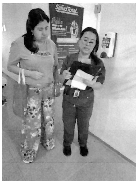
FOTO 4 APERTURA BUZON- USUARIA