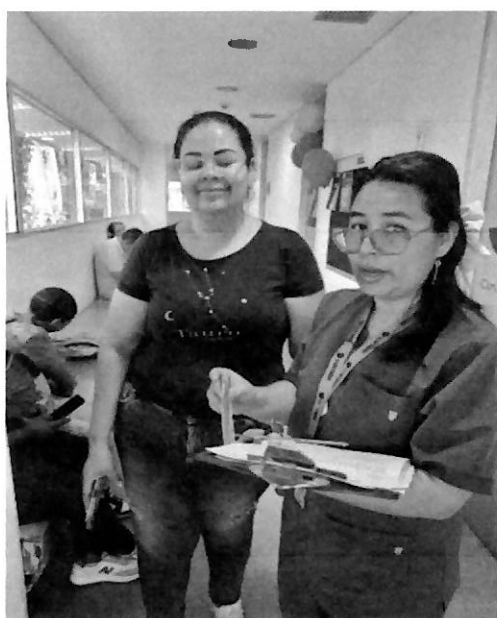
FOTO No 3 APERTURA BUZON- USUARIA

FOTO 1 VIRREY SOLIS CON LA COORDINADORA SIAU FOTO No 2 SOCIALIZACION IMPORTANCIA DE LOS BUZONES DE SUGERENCIA