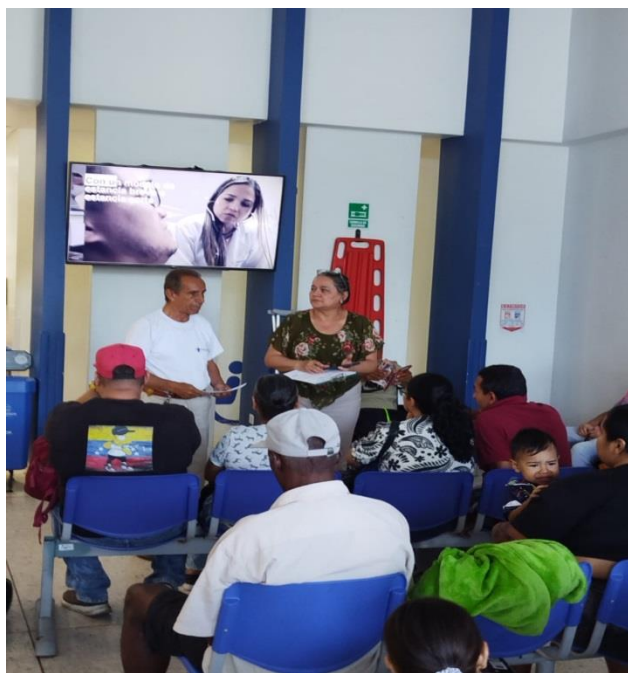
FOTO 4. REGISTRO FOTOGRAFICO DEL ACOMPAÑAMIENTO APERTURA DE BUZON