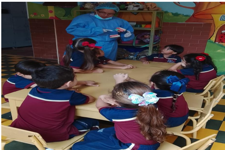
Prácticas De Higiene Y Salud Bucal En Población De Primera Infancia

Fuente de información. Hospital Raúl Orejuela Bueno E.S.E. 2025.