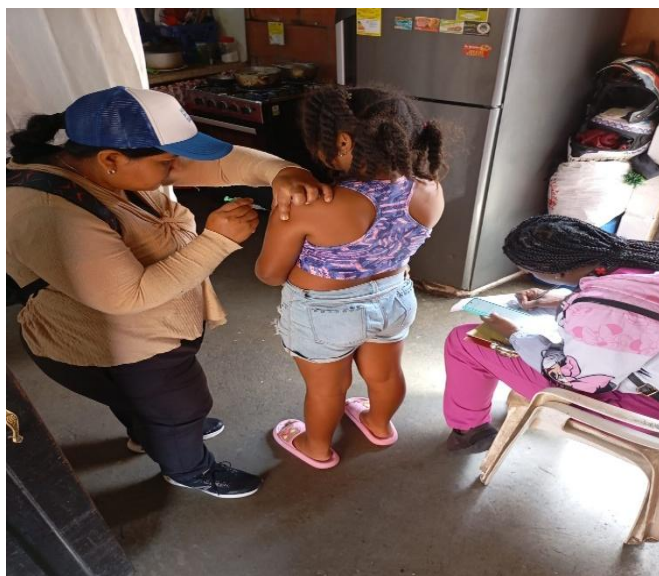
Registro fotográfico. Busquedas activas de vacunación

Fuente de información. Hospital Raúl Orejuela Bueno E.S.E. 2025