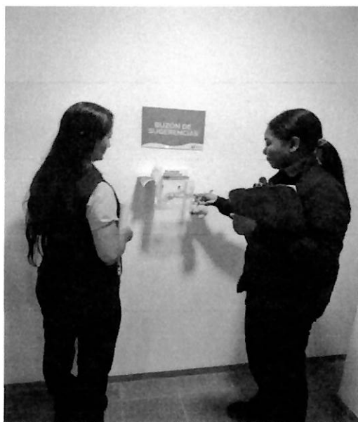
FOTO 2 SPERTURA BUZON CON USUARIA