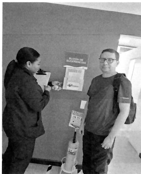
FOTO 3 APERTURA BUZON CON USUARIO